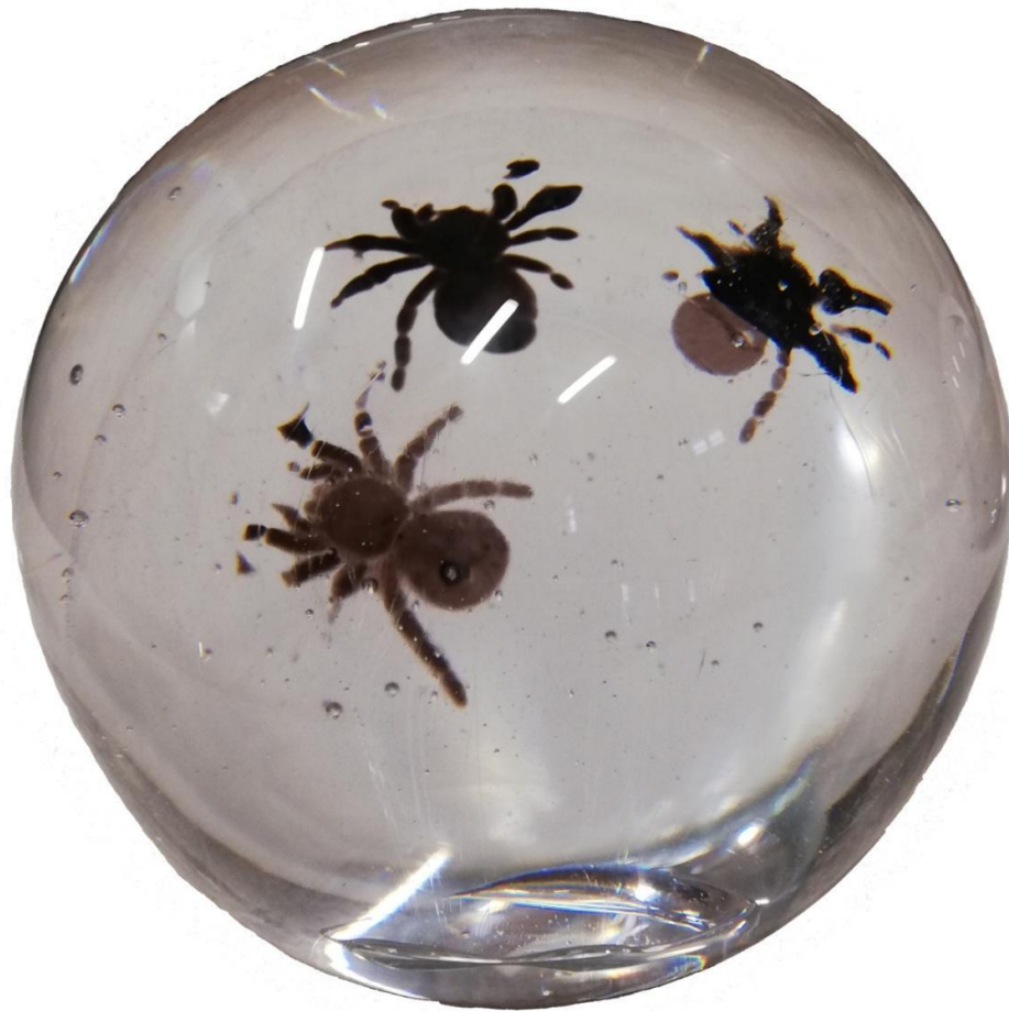
Foto: Kolme ämblikuga klaaskuul

Seejärel soojendasin ahjus toorikud uuesti üles ning võtsin peale uue kihi kirkast klaasi.