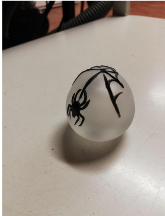
Fotod: Vasakul uued toorikud, paremal liivsöövitusel töödeldud õõnes toorik