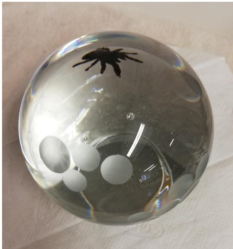
Foto: Lõiked klaaskuulil

Järgmise etapina lõikasin ja poleerisin kuulid. Kuna klaas on suurepärase materjal optiliste efektide tekitamiseks, otsustasin seda võimalust kasutada. Lõigates käialõikega klaasi pinnale kuulid jääb mulje nagu oleks ämblike sees palju, kuigi tegelikult on ainult üks – tekkis terve pesatäis ämblikke.