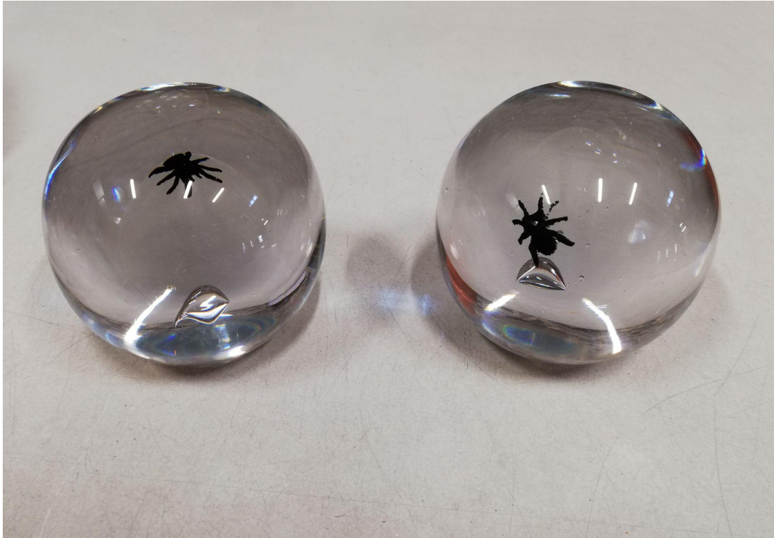
Foto: Klaaskuulid ilma lõigeteta

Kõrgemal paigutuva ämblikuga toorik osutus sobilikumaks käialõigetega mängimiseks ning seeläbi optilise efekti tekitamiseks.