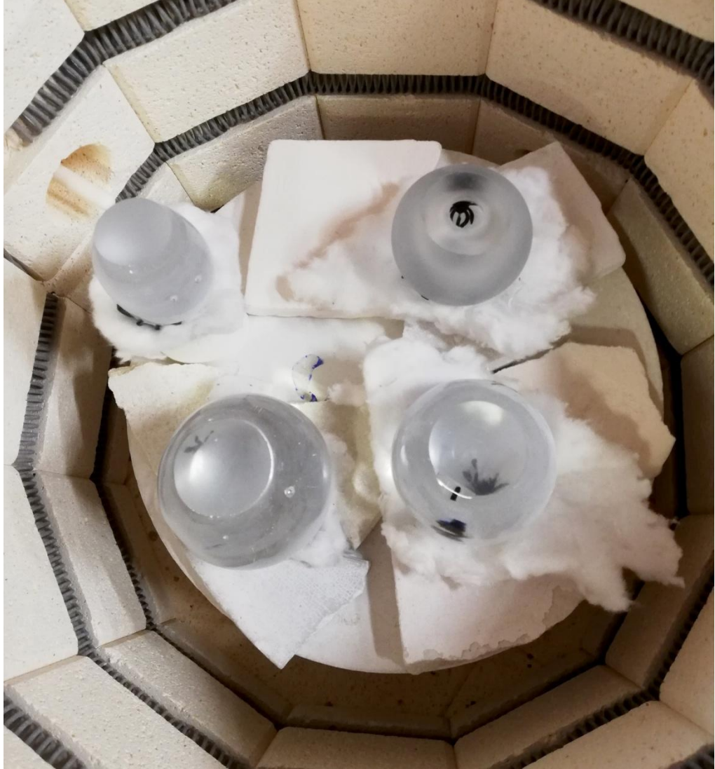
Foto: Toorikud ahjus