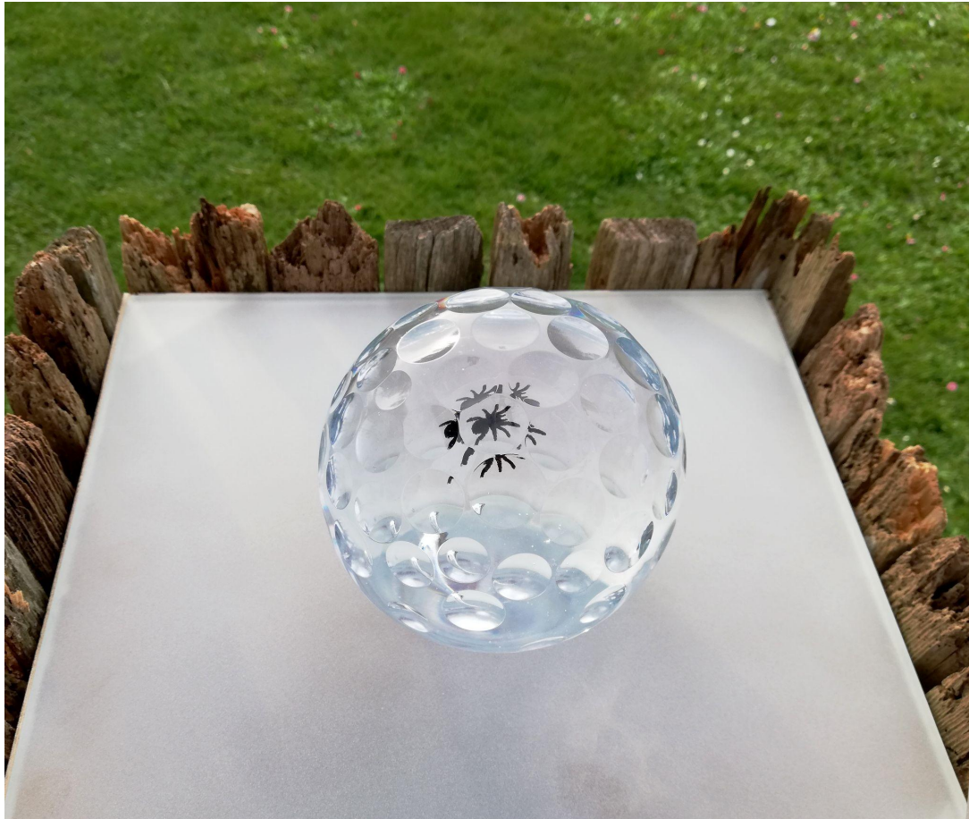
Foto: Klaaskuul postamendil

Eksponeerimiseks otsustasin kasutada väiksemat hämaramat ruumi, et tekiks paralleel minu esimese ämbliku looga. Sellest tulenevalt otsustasin kasutada ka vana ajahambast puretud puitu.