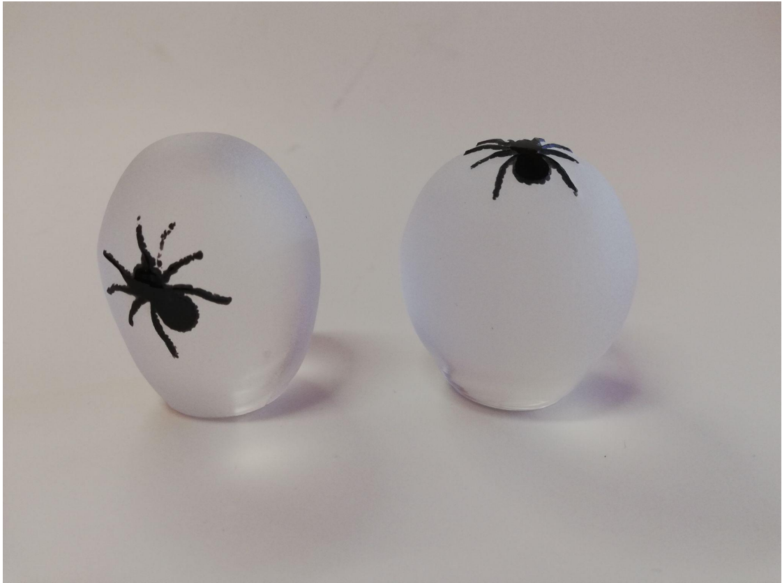
Fotod: Uued toorikud

Valminud katsetust analüüsidest tundus, et ämbliku paigutus on vale, sest läbi lihvitud kuulide ämbliku nägemiseks peaks ese olema paigutatud silmade kõrgusele. Sellest tulenevalt puhusin jälle uued toorikud.