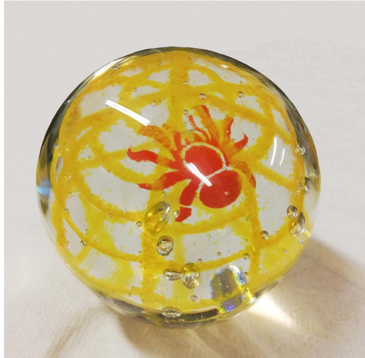
Foto: Vasakul punase ämblikuga toorik, paremal valmis klaaskuul.

Teiseks puhusin uued toorikud kirka klaasi ja musta värviga, millest kolm on täismass klaasist ja üks seest õõnes. Valminud katsetustest eelistasin täismass klaasi ja minimalistlikku ämbliku kujutist, mille abil tulid parmini välja klaasi optilised võlud.