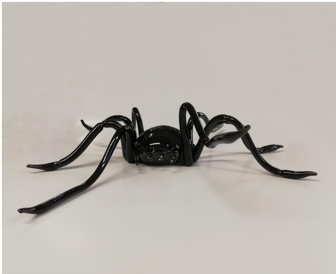
Foto: Must ämblik

Pärast klaaskuulide valmimist tekkis idee puhuda päris ämblik, et hiljem eksponeerida see koos klaaskuulidega. Puhusin mustast klaasist ämbliku. Eesmärk ei olnud valmistada peensusteni korrektset ämblikku vaid pigem jätta ta mänguliseks. Must värv andis ämblikule juurde teatava õudusttekitava elemendi.