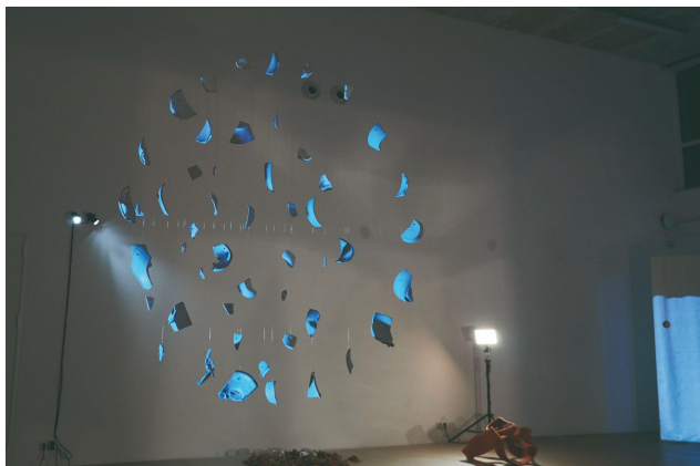
Lisa 2 Teos “Mitte katki” näituselt Kaasnähtused