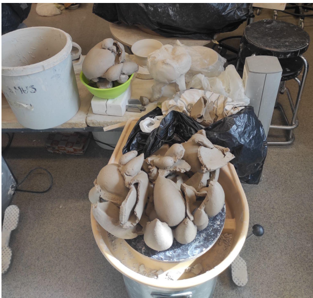
(Lisa 4: Hävinenud katsetus)

tekitas minus rohkem pahameelt ja viha, kui elevust ja soovi edasi töötada. Kooliga ette võetud Barcelona reisi tõttu pidin töö panema pausile ja tegin seda hea meelega teades samas, et niimoodi edasi minnes ma kaugele ei jõua. Kuid keskkonnavaheetus tõi uusi mõtteid ja värsket hingamist. Reisilt tagasi tulles oli mul selge ka uus teostusviis. Uueks plaaniks sai ehitada ribadest anum ja selle peale liimida kipsvormide abil tehtud tilga kujutised ning hiljem lõigata töö asuurseks nendest kohtadest kus tilkasid polnud. Selle teostusega ma ka edasi läksin ja olin tulemusega väga rahul. Tuli tagasi motivatsioon ja tahe seda tööd valmistada ning sellest tehnikas mu lõputöö lõpuks valmis. Isegi kui esimene katsetus selles tehnikas hävis, siis sain sellest lihtsalt õppida ja järgmise paremini teha. (Lisa 4)